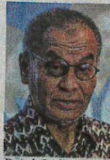
Datuk Seri Dr Dzulkefly Ahmad