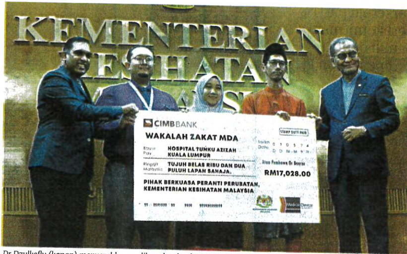
Dr Dzulkefly (kanan) menyerahkan replika cek zakat kepada wakil Hospital Tuanku Azizah Kuala Lumpur pada Majlis Anugerah Perkhidmatan Cemerlang (APC) Pihak Berkuasa Peranti Perubatan (MDA), di Putrajaya, semalam.

Beliau berkata demikian ketika ditanya keperluan menutup sekolah ekoran keadaan cuaca panas sejak kebelakangan ini dan kelmarin, Menteri Sumber