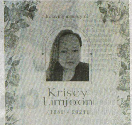
Mendiang yang juga bekas wartawan akhbar tempatan menjadi penderma organ pertama pada tahun ini di HQE Kota Kinabalu.

"Semoga roh mendiang diberkati dan pihak keluarga diberi kekuatan menghadapi kehilangan ini," katanya.