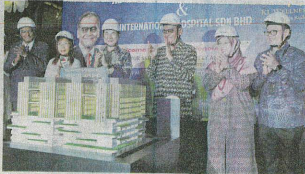
Dr Dzulkefly (tiga dari kanan) melancarkan hospital 624 katil oleh KL International Hospital di KL Wellness City Galeri Bukit Jalil.

"Sumbangan ini meningkatkan usaha kerajaan untuk menyediakan penjagaan kesihatan yang boleh diakses kepada masyarakat kurang berkemampuan," katanya.